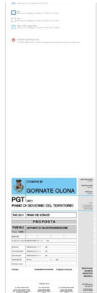
Immagine – VAS Gornate Olona – Antenne di radiotrasmissione